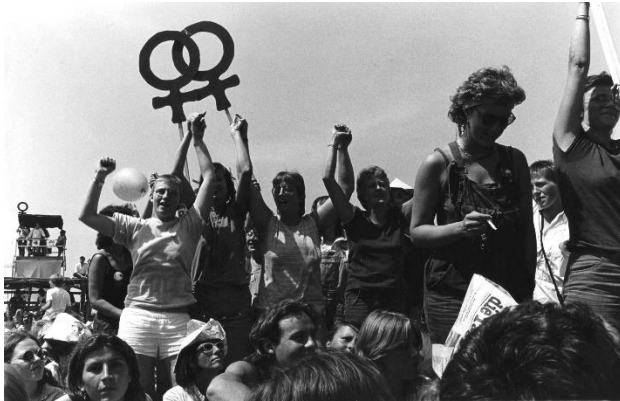
Feministischer Block auf der Friedensdemo am 10.6.1982 in Bonn

Für eine Veröffentlichung im Zusammenhang mit dem Onlinegang des Digitalen Deutschen Frauenarchivs werden die folgenden Pressefotos zur Verfügung gestellt. Die Bildnachweise müssen bei jeder Verwendung vollständig, wie hier genannt, zitiert werden.