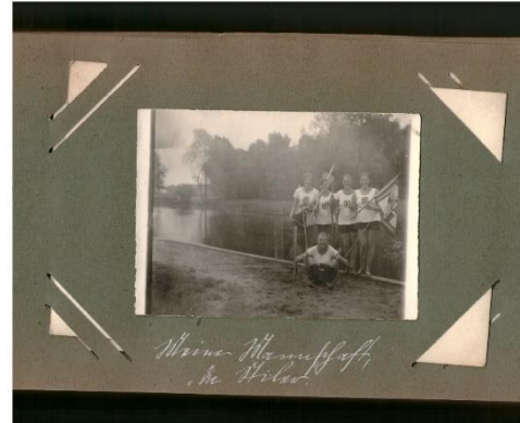
Die Einrichtungen des i.d.a.-Dachverbands sind sehr darum bemüht, bestehendes Material vor dem Verfall zu schützen und über die Digitalisierung dauerhaft für nachfolgende Generationen zugänglich zu machen, Fundstück einer anonymen Ruderin, um 1925, Berlin/Brandenburg; Bildnachweis: Spinnboden-Archiv