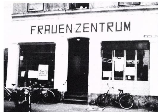
Das 1975 eröffnete Bremer Frauenzentrum ‚Auf den Häfen‘