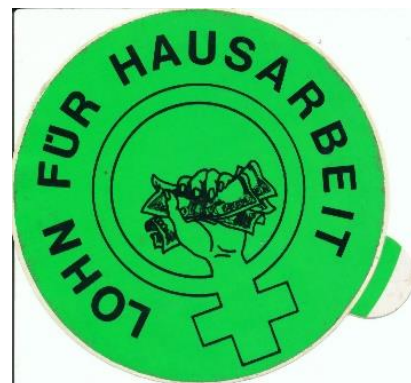
Button Kampagne „Lohn für Hausarbeit“, West-Berlin, 1970er/80er Jahre