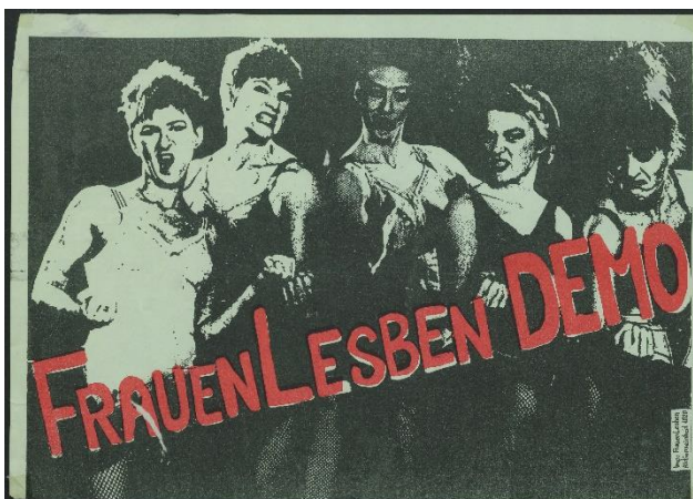
Plakat FrauenLesben-Demo, West-Berlin, ca. 1980er Jahre