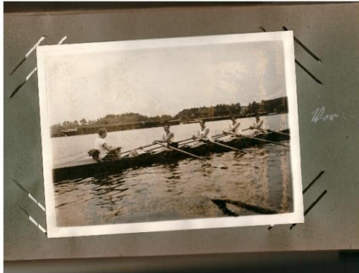
Viele, teils auch anonyme Nachlässe finden den Weg in die Lesben-/Frauenarchive und werden hier aufgearbeitet, Fundstück einer anonymen Ruderin, um 1925, Berlin/ Brandenburg