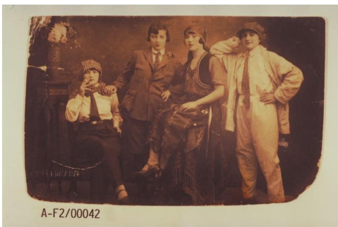
Spannende, teils unbekannte Geschichten von Frauen und der Frauenbewegung aufzubereiten und auffindbar zu machen, ist ein wichtiges Ziel des DDF und der i.d.a.-Einrichtungen, Symbolbild DDF, anonymes Gruppenbild, um 1920