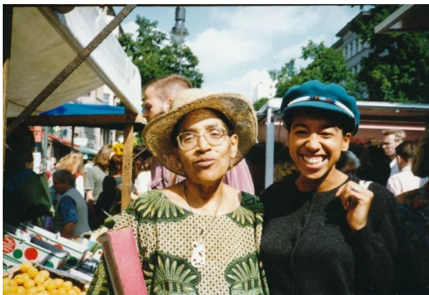
Die Autorinnen und Aktivistinnen Audre Lorde (li.) und May Ayim vor Verkaufsständen auf dem Winterfeldplatz in Berlin-Schöneberg, 1992